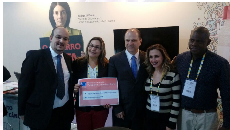
Julho/17 23º Conselho Nacional de Secretarias Municipais de Saúde