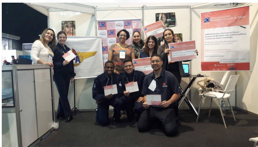
Julho/17 Reunião anual da Sociedade Brasileira para o Progresso da Ciência (SBPC) Belo Horizonte