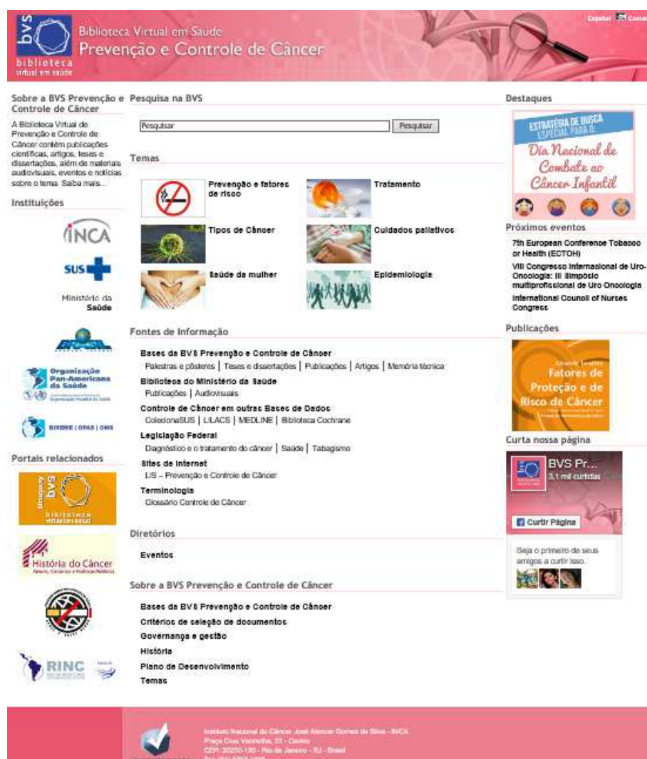
Figura 1. Portal da BVS Prevenção e Controle de Câncer http://controlecancer.bvs.br/

Este projeto está alinhado com a Política Nacional de Atenção Oncológica (PNAO) 1 e com o Programa Mais Saúde: Direito de Todos, eixo nº 4 - Força de Trabalho 2 .